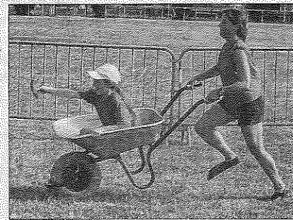
Plusieurs épreuves des olympiades étaient au programme : couper une bûche avec une scie à deux mains et faire une course de brouettes chaussé de palmes.