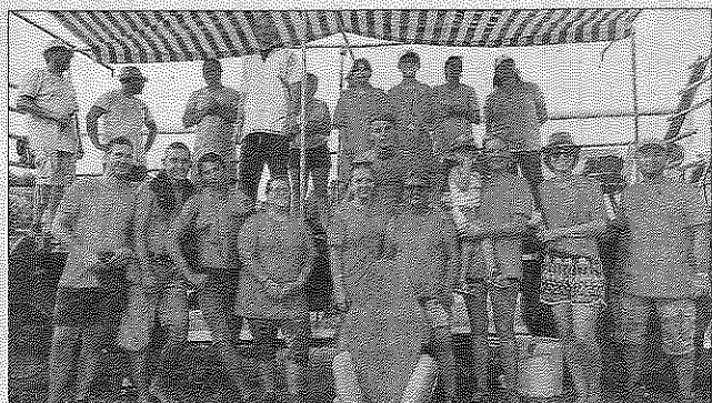
Ces jeux ont permis aux habitants de se découvrir et d'échanger.